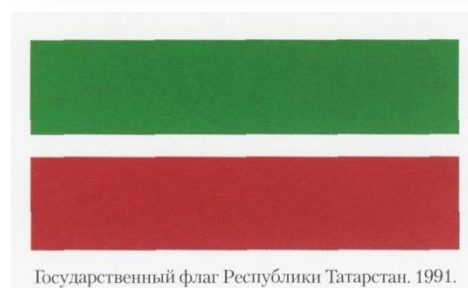
Государственный флаг Республики Татарстан. 1991.