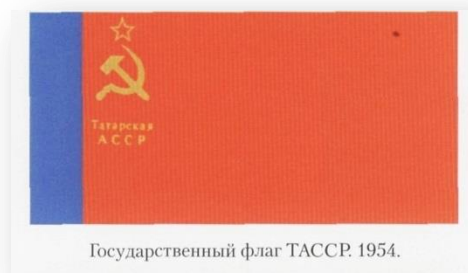
Государственный флаг ТАССР. 1954.